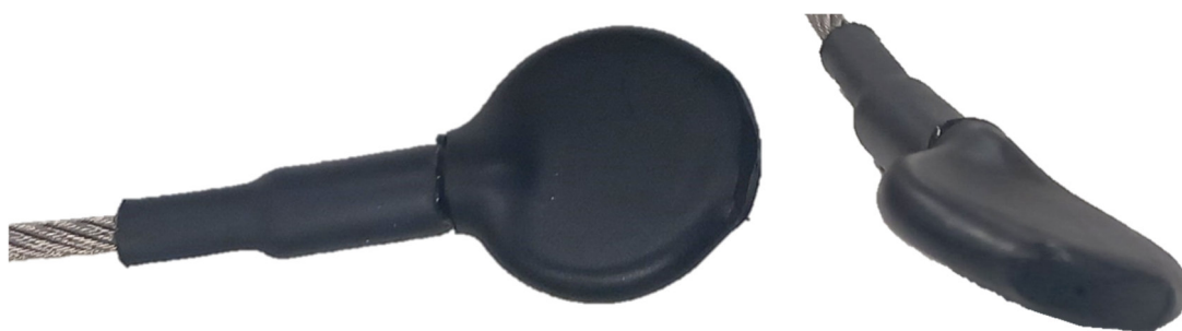
Fig. 1 – Anneau d’extrémité du câble de la poignée répéteur secours recouvert de gaine thermo rétractable End ring of the reserve override ripcord cable covered with heat shrinkable sleeve

This modification is mandatory and must be applied before March the 31 st 2024 for the harness-containers listed in paragraph 1. A. (1).